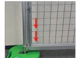
※2 落とし棒式ロック機能