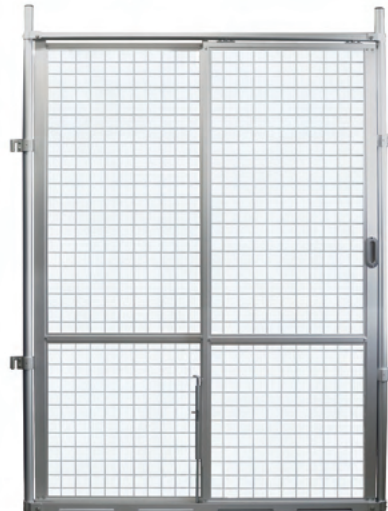
※1 ゴミがつまりづらい設計