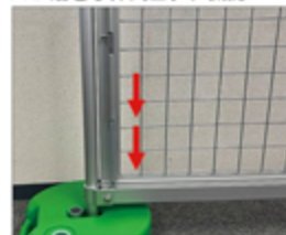
※2 落とし棒式ロック機能