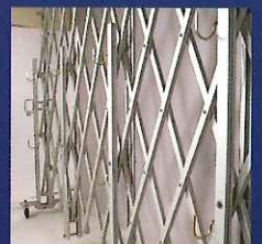
▲二段の単管受けフック